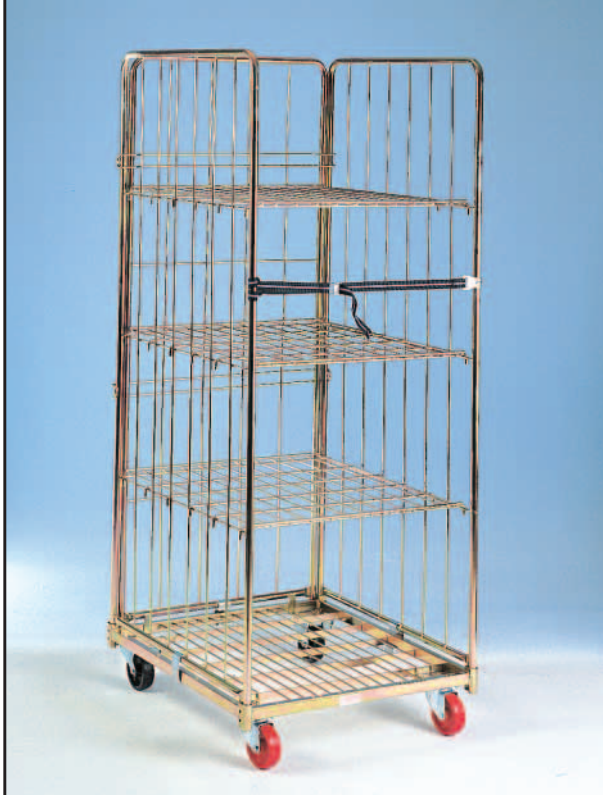
ROLLPAK accessoriato di III a PARETE, RIPIANI e CINGHIETTA