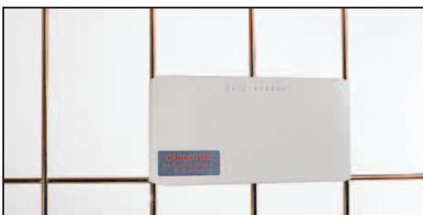
COD. 04.00.029.00 TARGHETTA mm. 220x110