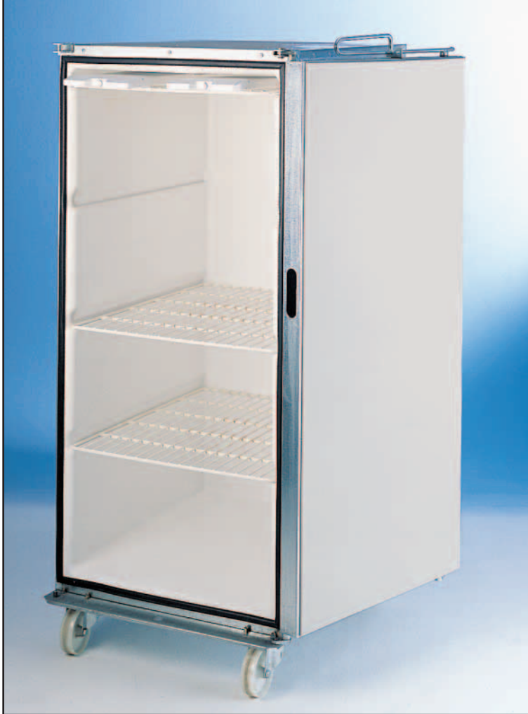
ROLLPAK FRIGO APERTO accessoriato di ripiani e piastre eutettiche