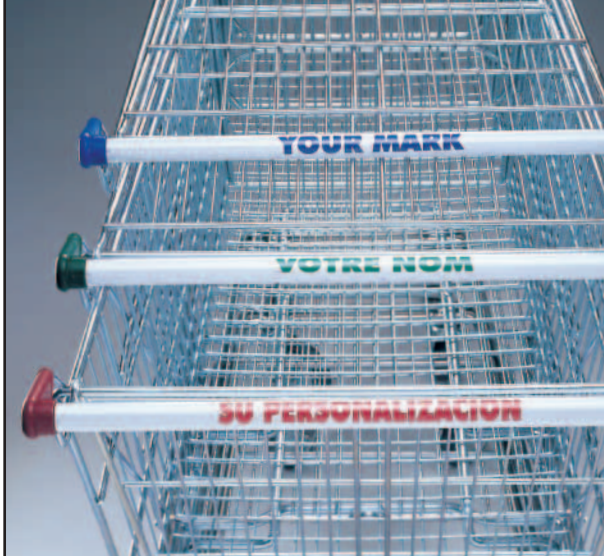
COD. 01.00.012.00 PERSONALIZZAZIONE manico