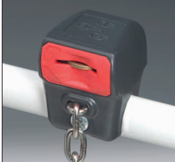
COD. 01.MDCS. LUCCHETTO CAUZIONALE da 0,50 - 1 - 2 EURO