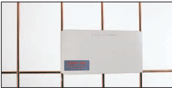
COD. 04.00.029.00 SCHILD mm 220x110