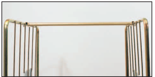
COD. 04.01.004.00 KLEIDERSTANGE