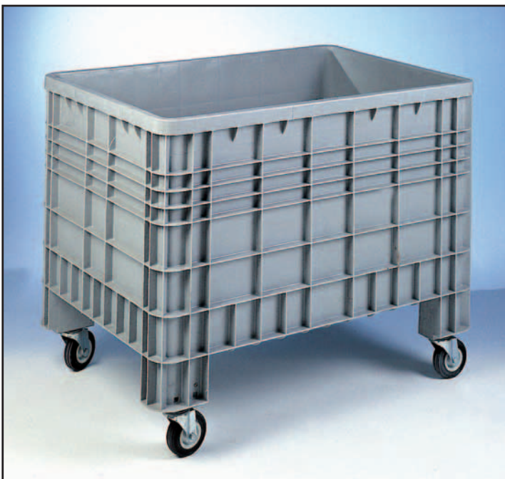
PLASTIC CONTAINER LT 600 Mit 4 Lenkrollen mm 106x40