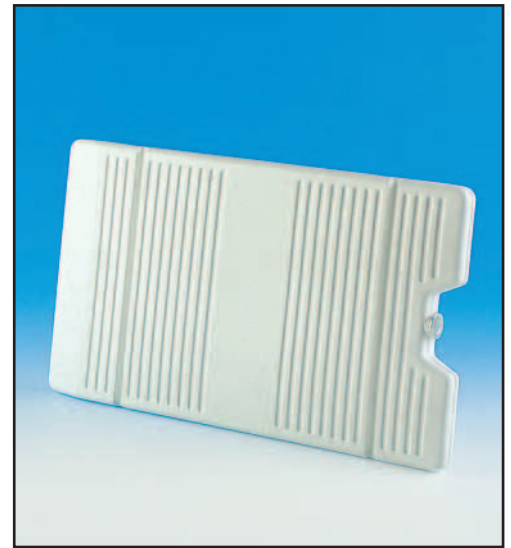
COD. 04.33.002.00 EUTEKTISCHE PLATTE CL 2200 Maße mm 215X375X25h