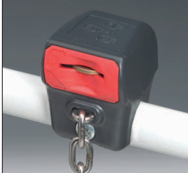
COD. 01.MDCS. MÜNZPFANDSYSTEM 0,50 - 1 - 2 EURO