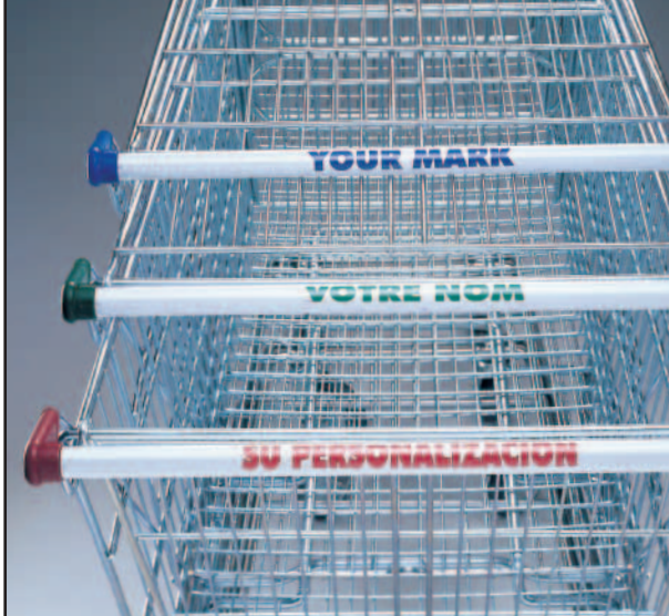
COD. 01.00.012.00 WERBEGRIFF NACH KUNDENWUNSCH