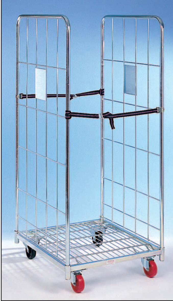
ROLLPAK F 25 mm 1680 mit Rollen Ø 106X40.