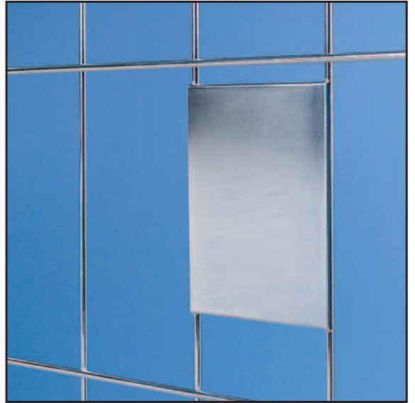
SERIENMÄßIG MIT SCHILD mm 160x200.